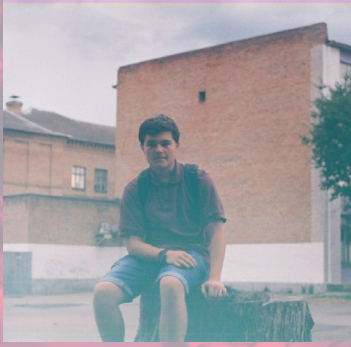
Роздуми минулого снігу

І вечір, як завжди надовго затягнеться, Запаляться зорі в скляному вікні, Ти знову вдома, й знов посміхаєшся, Гортаючи сторінки інтернетні, німі. Байдужо вдивляєшся в білий екран, Буваєш, що чаю чи кави завариш, Повернешся потім у свій «океан», І знову задумуєшся, знову мариш.